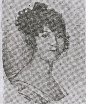
Надежда Осиповна Пушкина, мать А. С. Пушкина, посетившая в 1827 году Ново-Пятницкое и Кайболу. (Миниатюра художника Ксавье де Местра).