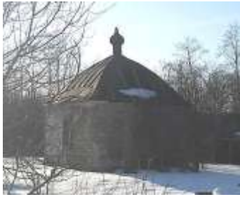
Часовня св. прор. Илии. Литизно. Фото 2012 г.

В Списке земельных владений Ямбургского уезда 1867 г. православные часовни указаны в деревнях: КЕРСТОВО – свв. апп. Петра и Павла, АЛЕКСЕЕВКА – св. прор. Илии, ЗАПОЛЬЕ – свв. апп. Петра и Павла, МАЛЛИ – свв. апп. Петра и Павла, РАГОВИЦЫ – две часовни свв. апп. Петра и Павла. По епархиальным сведениям 1885 г. в Раговицах изменились наименования часовен, были построены новые: одна св. Николая Чудотворца, вторая – св. Параскевы Пятницы. 236