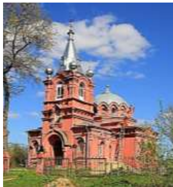
Фото 2012 г.