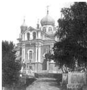
Фото 1910-х гг.

Благодаря усердию искусствоведа и краеведа А.Н. Белобородова в 2012 г. состоялось открытие на стене Скорбященского храма мемориальной доски ямбургскому купцу II гильдии Д.В. Полякову (изготовлена на средства Белобородова из черного гранита). 73