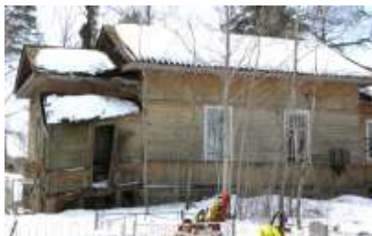
Фото 2013 г.

Часовня в дер. Большое Стремление была построена еще до 1719 г. Церковь перестроена из часовни в 1912 г., освящена в 1913 г. во имя свт. Николая Чудотворца и св. Преподобного Арсения Коневского. В 1936 г. закрыта, священник и церковный староста арестованы.