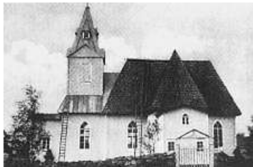
Кирха о. Тютарсаари (слева) просуществовала до 2005-2006 гг., но в последние годы использовалась в качестве сарая. Фото 1940 г. Кирха о. Лавансаари (справа) возведена в 1783 г., колокольня перестроена в 1910 г. Разрушена в годы Великой Отечественной войны. Фото 1911 г.