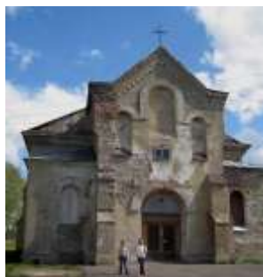
Фото 2012 г.