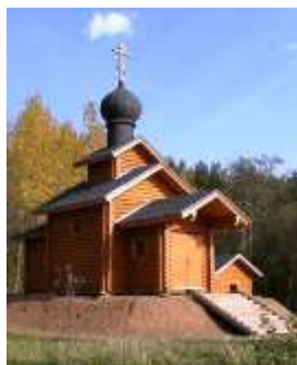
Фото 2012 г.

В 2007 г. к завершению реставрации церкви было приурочено освящение на острове Кампергольм (ранее – Петровский) вновь возведенной ЧАСОВНИ В ЧЕСТЬ СВ. ФЕОДОРА СТРАТИЛАТА – небесного покровителя сподвижника Петра I адмирала Ф.А. Головина (1650-1706), и в память русских воинов, погибших во время Северной войны в 1700 г. на переправе через Нарову. Событие состоялось благодаря благотворительной программе, проводимой Центром национальной славы России. На церемонии присутствовали: митрополит русской православной церкви в Эстонии Корнилий, прямой потомок графа Головина И.А. Шидловская (урожд. Головина, Франция), директор Государственного Эрмитажа М.Б. Пиотровский, А.Ю. Талацук – ректор гос. художественно-пром. академии (СПб.) им. А.Л. Штиглица (основанной им в 1879 г.) и др. Часовня составляет единый ансамбль с установленным в 1996 г. памятным знаком русским воинам, павшим в ходе Северной войны 1700-1721 гг. Освятил ее благочинный Ямбургского благочиния Санкт-Петербургской митрополии прот. Леонид Степанов. 138