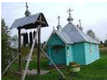
Фото 2011 г.