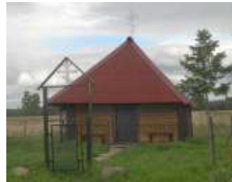
Часовня в Раговицах. Фото 2013 г.

Часовня св. Параскевы Пятницы в Раговицах впервые построена в 1737 г., последний раз перестроена в начале XX в. 28 июля 2012 г. отремонтированная часовня была освящена настоятелем Никольской церкви в Котлах о. Александром Вахрушевым. 237