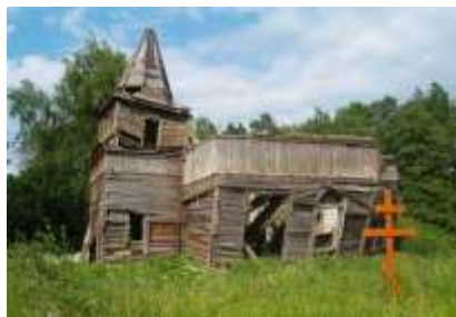
Фото 2013 г.

Усадьба, которая когда-то здесь была, принадлежала родственникам Ганнибалов, бывала у них и мать А.С. Пушкина – Надежда Осиповна. С тех времен не осталось ничего, кроме пустой и полуразрушенной деревянной часовни, стоящей на развилке дорог.