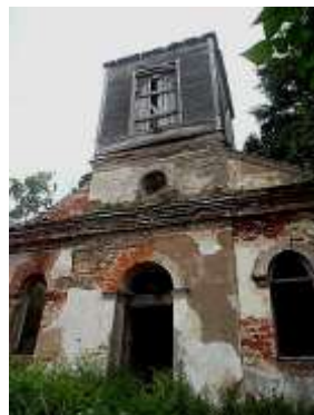
Церковь Михаила Архангела в Удосолово. Фото 2013 г.

В 2003 г. церковь была поставлена на учет как объект культурного наследия. Но до наших дней здание, с уникальной постройкой на деревянных шипах без единого гвоздя, дошло сильно разрушенным, пострадало и от рук вандалов.