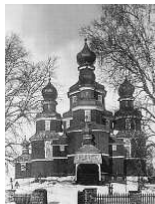
Скорбященская церковь в Кёрстово. Фото 1910-х гг.

В 1938 г. Николаевский храм был закрыт, вновь открыт в период немецкой оккупации, в 1942-1944 гг. В 1950-е гг. в церкви устроено хранилище.