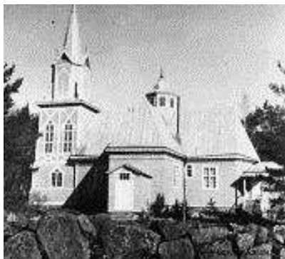
Кирха о. Сейскари (слева) построена в 1878 г. Фото 1939 г. Кирха о. Суурсаари (справа), построена в 1768 г., в 1892 г. пристроена трехэтажная колокольня. Фото 1943 г. Обе церкви разрушены в годы Великой Отечественной войны. 298