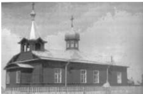
Венкульская Никольская церковь.