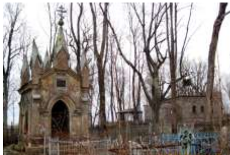
Часовня и церковь на Ивангородском кладбище. 2012 г.

В 1919 г., во время Гражданской войны, церковь частично разрушена, затем восстановлена, была действующей до Второй мировой войны. Частично разрушена в 1944 г. и закрыта.