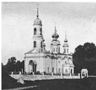
Храм Михаила Архангела. 1912 г.

Статья составлена с участием искусствоведа и краеведа А.Н. Белобородова и заведующей Большелуцкой библиотекой А.В. Сатушкиной