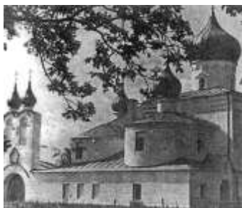
Фото 1930-х гг.