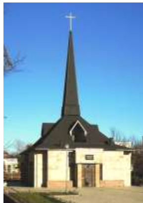
Ямбургская евангелическо-лютеранская церковь. 2013 г.