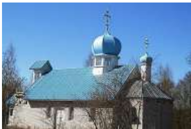
Фото 2011 г.