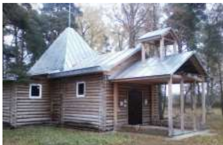
Фото 2013 г.

В 1996-2005 гг. новый храм в Большом Кузёмкино построен по инициативе жителей (арх. А. Шестаков). В 2000 г. зарегистрирован приход. Первая служба прошла в ноябре 2001 г. 196