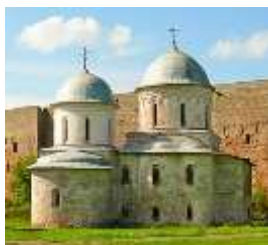
Фото 2012 г.