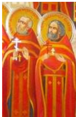
На фотографии фрагмент иконы «Собор святых земли Эстонской». 105

Священники – настоятели Успенского храма: 106