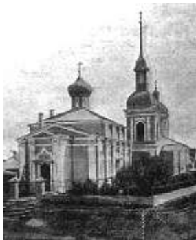
Никольская и Знаменская церкви. Фото 1900-х гг.

В 1944 г. во время военных действий под Нарвой храм разрушен. 125