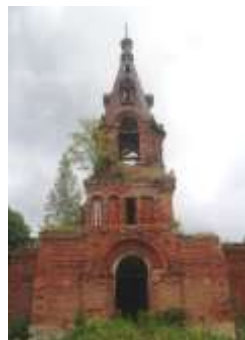
Фото 2013 г.

Церковь закрыта в 1936 г., в 1940 г. – официально. В 1942 г. во время немецкой оккупации богослужения возобновились нарвскими священниками-миссионерами. В годы хрущевских гонений на Церковь храм был вновь закрыт в 1962 г., пострадал от пожара в 1990 г. В настоящее время здание постепенно разрушается. 275