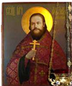
Икона Священномученика Александр Волкова, пресвитера, в нижнем храме Успенской церкви. Иконописец – Сергей Хайгора, член Митрофаньевского союза. 104