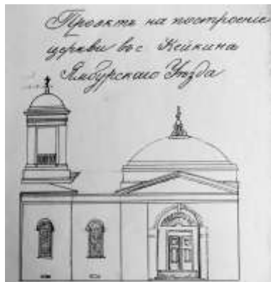
Фото документа из краеведческого архива Куземкинской б-ки