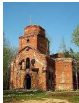
Никольская церковь. Фото 2013 г.