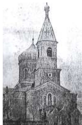
Никольская церковь. Фото 1920-1930 гг.

Церковь неоднократно перестраивалась. Деньги на строительство жертвовали владельцы поместий и местные крестьяне. В 1849 г. Никольский храм вновь перестроен, освящен 5 августа 1850 г. Но здание оказалось холодным, и поэтому было принято решение о строительстве каменного храма. 152