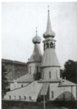
Успенский храм. Фото 1910-х гг.