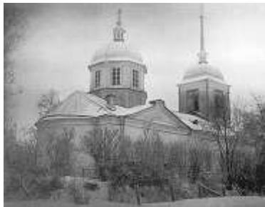
Церковь Михаила Архангела в Удолово. Фото 1925 г.