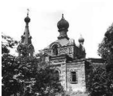
Фото 1980-х гг.