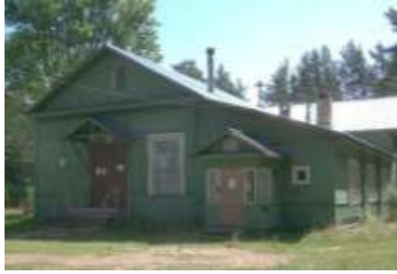
Церковь во имя свт. Николая Чудотворца. Справа – фото 2009 г.