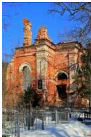
Фото 2013 г.