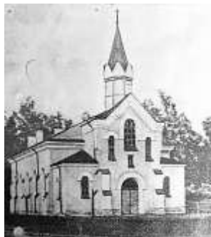
Фото 1878 г.

Два года в церкви была тюрьма-переселенка. 26 января 1938 г. церковь закрыта официально и передана под гарнизонный клуб. 342 Во время немецкой оккупации службы возобновились финским пастором с 1941 г. В 1944 г. церковь вновь закрыли, а здание после ремонта в 1951 г. использовали под клуб.