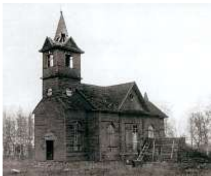
Церковь прихода Сойккола (дер. Заозерье). Фото справа – 1942-1943 гг. 293

В НОВОСЕЛКАХ (Novasolkka) с 1703 г. существовал молитвенный дом. Деревянная филиальная церковь на 150 мест построена в 1759 г. Финский приход Новоселки являлся филиалом от прихода Молосковицы, в 1834 г. присоединен к приходу Котлы.