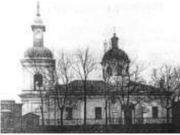
Знаменская церковь. Фото 1930-х гг.

Дата основания храма во имя иконы Божией Матери «Знамение» в Ивангороде является спорной. Согласно клировым ведомостям деревянная церковь построена в 1750 г., позже снесена из-за ветхости. 119 Каменная церковь на Горке с двумя приделами (Воздвижения Животворящего Креста Господня и св. прор. Илии) сооружена в 1786-1796 гг. на средства